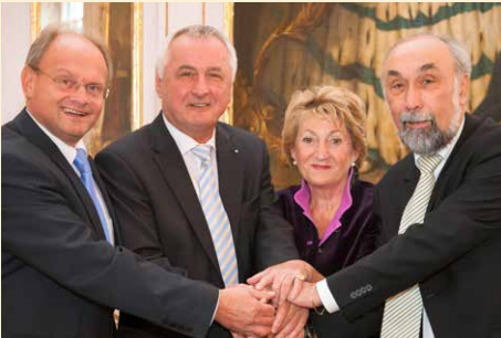
Das Präsidium des schwäbischen Bezirkstags