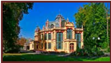
Das Parktheater in Augsburg.