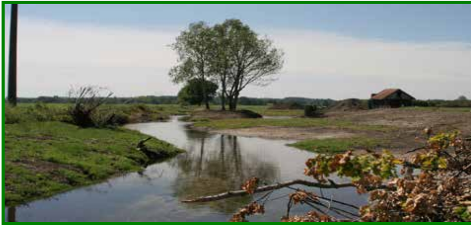
Ein Bach in Schwaben