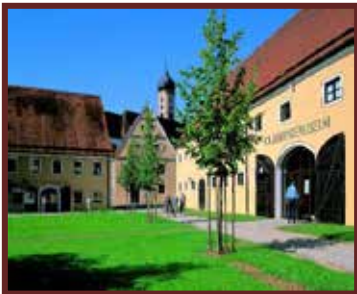
Das Volkskunde-Museum in Oberschönfeld.

Auf den nächsten Seiten werden Kultur-Einrichtungen in Schwaben vorgestellt.