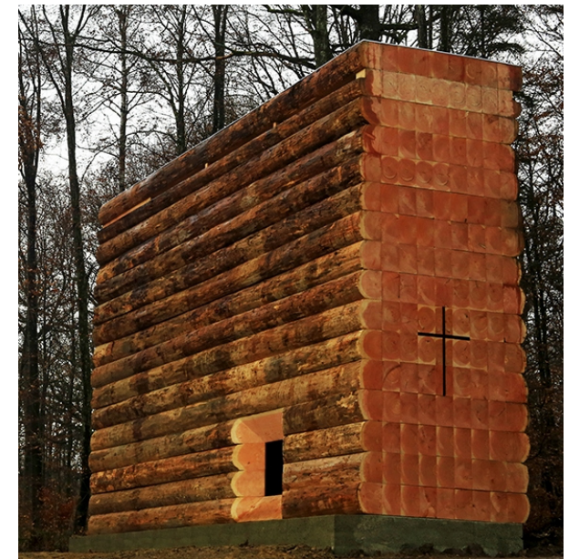
Wegkapelle am Radweg von Unterliezheim nach Finningen (außen)

– kleine Änderungen im Tagungsablauf vorbehalten –